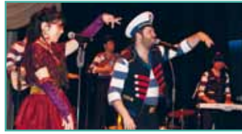
OPENING VOLKSKRING 8