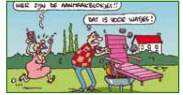
STOOK SLIM 12