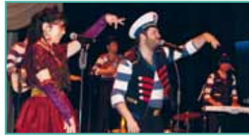
OPENING VOLKSKRING 8