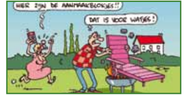
STOOK SLIM 12