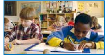
VEILIG NAAR SCHOOL