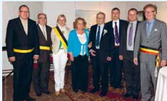
Gouden bruiloft (50 jaar)