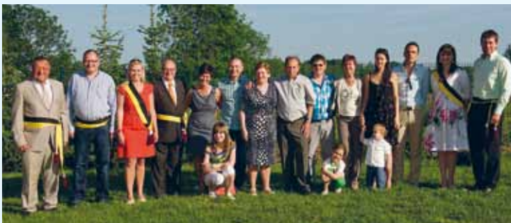
Gouden bruiloft (50 jaar)