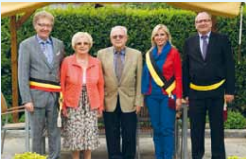
Gouden bruiloft (50 jaar)

Het gemeentebestuur, vertegenwoordigd door het college van burgemeester en schepenen, bracht hulde aan ondervermelde echtparen ter gelegenheid van hun gouden huwelijksjubileum en bood hen, samen met hartelijke gelukwensen, het traditionele geschenk aan.