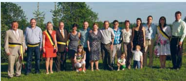
Gouden bruiloft (50 jaar)